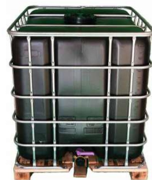
Cuve de récupération de 1 000 litres