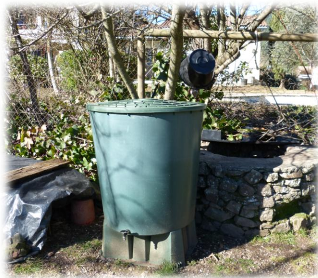
Cuve de 500 litres