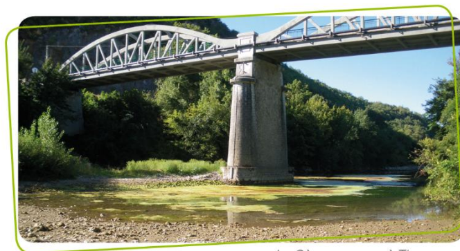
La Cèze en assec à Tharoux

Les impacts du réchauffement climatique vont aggraver cette situation. La température a déjà augmenté de 1,7°C dans le Gard entre 1958 et 2018. Et l'étude Eau et Climat 3.0, menée par le département du Gard, prévoit une augmentation des températures de 4°C d'ici 2100 si nous ne limitons pas nos émissions de gaz à effet de serre.